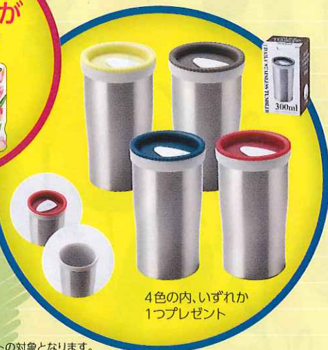
4色の内、いずれか 1つプレゼント