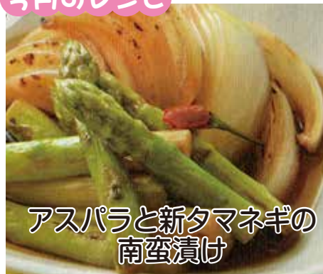
アスパラと新タマネギの南蛮漬け