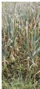
べと病に感染したたまねぎ

べと病は糸状菌というカビの一種が原因で起こる病気で、葉に褐色の病斑ができ、放っておくと茶色くなってカサついた感じで枯れてしまう病気です。見た目は太陽で葉っぱが焼けてしまったような感じになります。