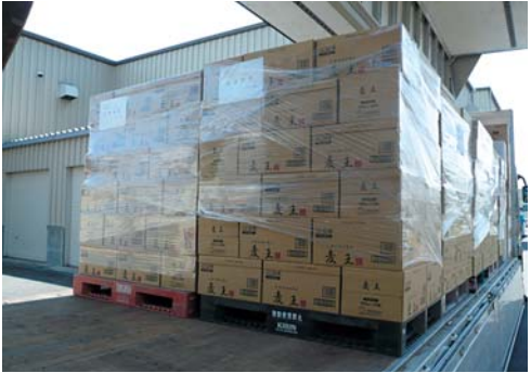
▲被災地へ送られる支援物資

y ~ D G ° Ö t C \, † h f Ö S G B t ' " ĩ f B ^ • † h M ' t ú ' " S ā M \, ĩ [ † b Đ y p > x a a S ĩ è Ö « G ä ĩ \ Ö T ĩ ʀ æ Ö ĩ Ü Đ w α x ĩ ĩ l α q w “ † g S t ' " ĩ ñ a ] • § ú > ù > d o M h i v † h Đ ú > x > D G > Ö t Ä § Z ' • h q ĩ ñ a α q “ C > M h i v † h Đ y ° Ö < ā M ĩ t > ú T ' S A “ , ĩ [ † b Đ