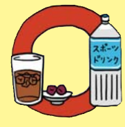
お茶と梅干し・ スポーツドリンクなど