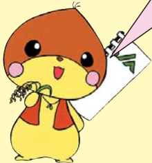
イメージキャラクター 「クリまる」

JA栗東市は、現在の田舎の元気やの隣に資材センターをOPENします。組合員の皆様からリクエストの多かった肥料、花苗などの農業用資材等を販売いたします。更にパワーアップした田舎の元気やにぜひご期待ください!!