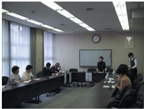
▲今後の活動について協議する女性部員

y D ä Ö Ü Ü t f ç • Q æ ç ± U Q Ü j ò æ « ä Ö è Ö H È s è x ĩ q > %5, † h Đ ĩ S U D > ^ i ä S < %5 g - è • 3 - è > x a S ĩ 7 ' s Æ ^ > æ Ö ' p b Đ