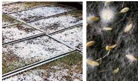
苗立枯病 (リゾプス菌)