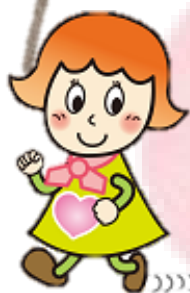
まっちちゃん JA女性組織 イメージキャラクター