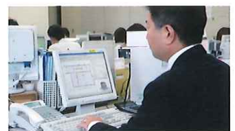
耐震診断 建物の地震に対する強さをコンピューターで数値化して診断します。