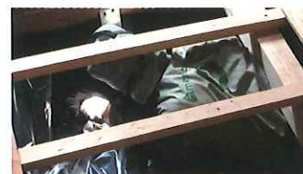
床下診断 床下から、基礎や土台の状況やシロアリ被害の有無などを確認、診断します。