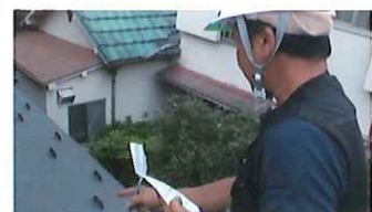
屋根診断 老朽化による割れや傷み、サビなどを隅々までチェックします。