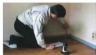
総合診断 レーザー測定器で床や柱の傾斜をみたり、雨漏りの有無など、全体を診断します。